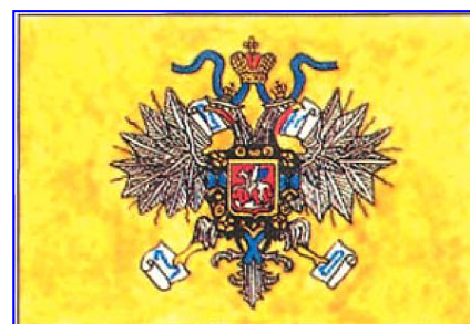
Царский морской штандарт

Создание флота Петром I повлекло за собой и учреждение орденов, которыми награждались лучшие флотоводцы. Экспозиция «Морская слава России» посвящена морским баталиям непобедимого святого воина Фёдора