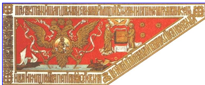
Гербовое знамя Петра I

В следующей экспозиции раскрывается роль Петра I, как учредителя Нижегородской губернии, военачальника, одержавшего множество воинских побед, императора, создавшего русский флот. Материалы выставки дополняют: Гербовое знамя Петра I, Царский морской штандарт, а так же обмундирование (реконструкция) воина Петровской гвардии.