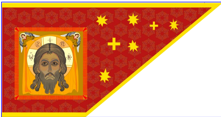
Стяг Всемиловейшего Спаса

Невскому и его славным победам: Невской битве и Ледовому побоищу. Стяг Всемиловейшего Спаса и хоругви, с которыми юный князь вёл дружину на битву, добавили бы ярких красок в материал экскурсии, подчеркнули роль веры Христовой в Победу! Русский поэт Николай Языков писал: «...отважней душа и десница, когда перед бодрым полком хоругви заветные плещут».